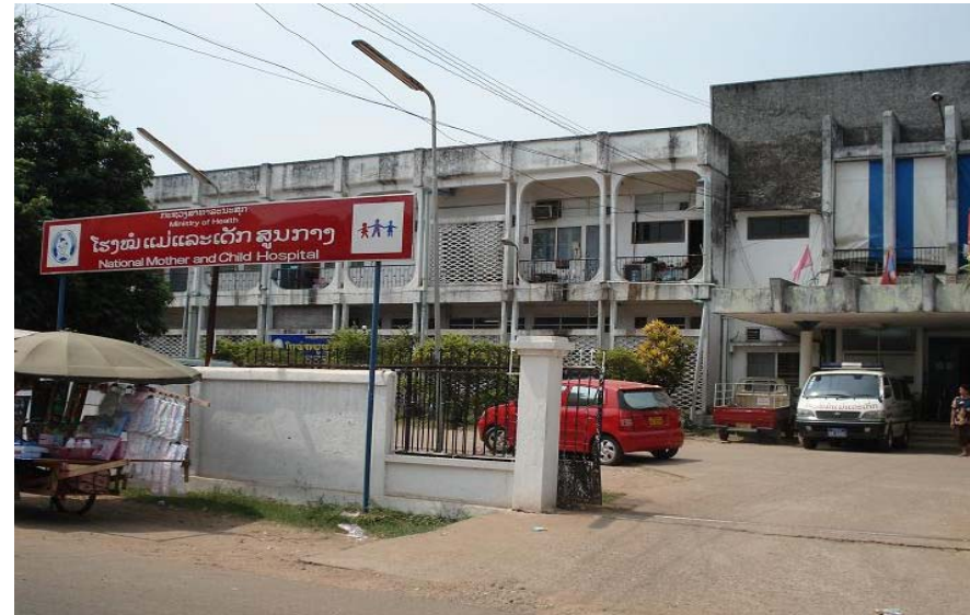
Mother and Child Health Hospital, Vientiane

Mahosot Hospital is the first and most important health center in Laos which is dedicated to the diagnosis and treatment of infectious diseases and also serves as an important medical research and training centre. It has 300 bed capacity, 113 doctors and 300 nurses.