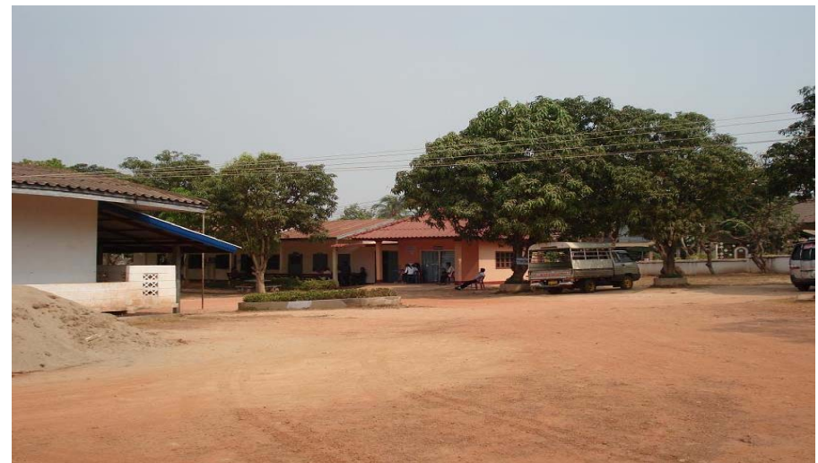
Mother and Child Health Hospital, Xaythany district